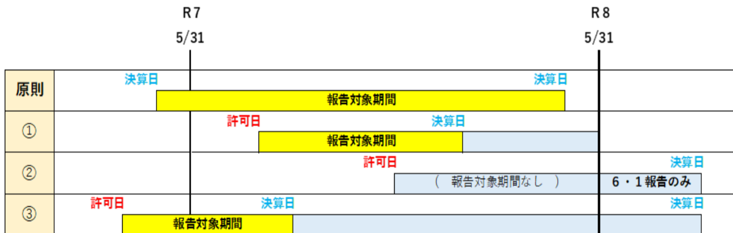
※ 許可日と決算日の関係モデル図