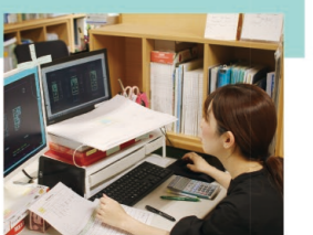
令和3年6月修了生 20代 女性

設計事務所で設計アシスタントとして図面作成を行うほか、土地・建物調査などの業務も担当しています。建築に深く関わることができ、充実した職業生活を送っています。訓練では、建築の基礎知識や住宅の施工方法、CADの操作や建物の設計方法など多くのことを学ぶことができ、習得した知識・技能をフル活用しています。資格取得に力を入れられる環境も整っており、建築CAD検定2級を取得できたことでスキルアップできました。建築に関するお仕事を目指されるのであれば、どの訓練も役に立つと思います。ぜひ受講してみてください。