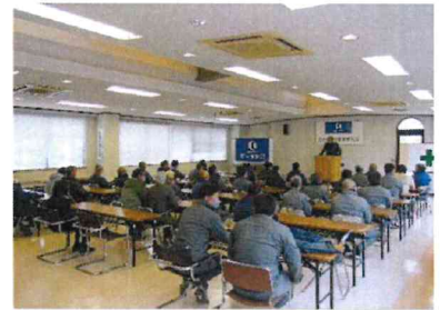
年末の社長あいさつ

友人の紹介で現場の監督として入社することになりました。 入社後の印象は、現場もちろんですが細やかな原価管理や工事以外の活動が他とは全く違ったことです。 新しい取り組みには瞬時に対応し、資格・免許所得のための制度も充実しているので環境もとてもいいと思います。