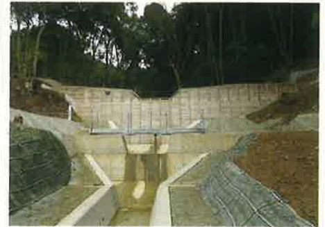
林地荒廃防止事業火山第4号工事 令和5年度林野庁長官及び熊本県知事表彰受賞

「女性での現場監督は苦勞がありそう」と思われるかもしれませんが、実際は男女差を感じることはなく働いています。本人がステップアップしたい場合は、会社全体でサポートできる社風があります。現在はGPSを使った重機の発達など日々進化しており、現場の負担は軽減してきています。女性や経験のない方でも気軽に挑戦すると、やりがいを感じられる仕事だと思います。