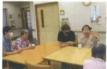
R3年度入職スタッフの様子

ホームページで検索した際に、利用者の方と職員の方の楽しそうな笑顔が印象的で、年間を通じて様々なイベントが行われているところが良いと思いました。入社後の印象は、施設内が明るく、立ち回れるまで職員の方が優しく丁寧に指導して下さるので、安心して仕事に取り組んでいます。