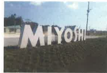
御代志駅前広場サイン整備工事 竣工写真

この会社を選んだきっかけは、自分の想いが叶えられると思ったからです。自分の想いは、私はいつか自分の地元で地域貢献がしたいという強い想いと、高校生の時に学んだ建築の知識を仕事で役立てたいという将来への想いの2つです。この両方の想いを叶えることができる会社はこの会社しかないと感じて入社しました。入社して今年で2年目になりますが、この気持ちは間違っていないと実感しています。