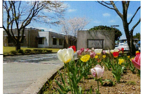
水生苑 正門の花壇

地元の安定した職場で働きたいと思っていたところ、タイミング良く募集が出ていたのがきっかけです。20歳代～70歳代までの幅広い世代の職員がいますが、和気あいあいの雰囲気、働きやすいと思います。ご利用者から「ありがとう」と言ってもらえることに、やりがいを感じます。