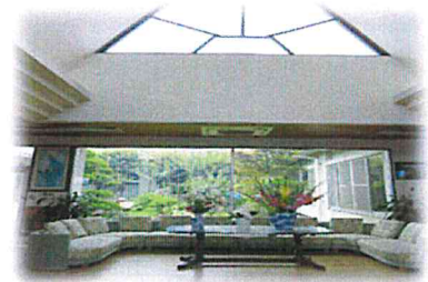
にしき園玄関ホール

～自分らしく暮らす～をモットーに利用される方の状態に応じた支援を展開しています。当法人は介護の複合施設（特別養護老人ホーム、居宅介護支援事業所、デイサービス、グループホーム）があり、さまざまな施設について学びを深めることができます。また、地域へも積極的に関わりを持ちながら、出前講座なども行っています。利用者様や地域の方に満足頂けるサービスを目指しています。