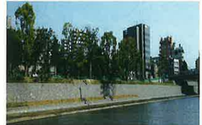
白川大江護岸工事

昭和39年創業以来、土木・舗装・とび・土工業などを主たる事業として、国土交通省・熊本県・熊本市などの公共工事を中心に受注・施工を行い、地元業界では上位クラスを目指しており、尚且つ目標工事量を確保して社員に利益を還元することを経営方針としている会社です。