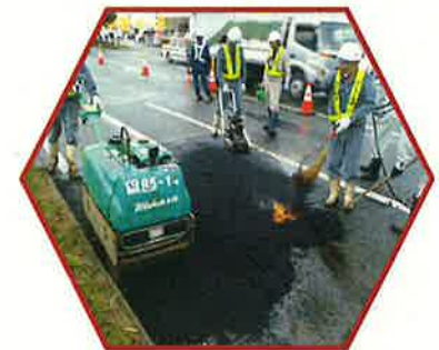
熊本地震復興工事：田井ノ島交差点

平成28年4月の熊本地震で、道路や橋が崩れ、水道などのライフラインも寸断され、安心・安全な生活が当たり前では無いことを経験し、熊本に「安心・安全」を取り戻し、元気な熊本を作る仕事が出来たと思い就職しました。当社が請け負った、代継橋や白川大江などの護岸工事は、人々を水害から守る大切な仕事です。