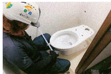
トイレ取付施工風景

マンションや住宅・施設等の給排水設備工事を行う会社です。 取引先が充実しているため、業績は安定しています。 配管技術を身につければ年齢に関係なく昇給できます。 社会保険完備しています。