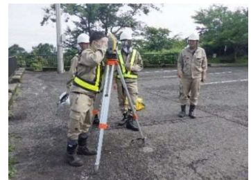
新入社員研修風景

当社は、地域の皆様が快適な暮らしを続けるために必要となる道路や河川、港、公園などの社会資本を形づくる「測量・設計」を行う会社です。近年はDX化に伴い新技術を用いた測量（ドローン・レーザー測量など）や3次元設計など、若手技術者を中心として積極的に取り組んでいます。