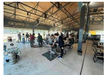
全体イベントBBQ風景

入社のきっかけは、学生の頃に測量に興味を持ち、地元で貢献していきたいと思い、旭技研コンサルタントに入社しました。会社の印象は働きやすく、雰囲気がとても良い職場だと感じました。新入社員研修では、先輩社員の方々が詳しく丁寧に教えてくださいます。未経験の方はもちろん、女性の方も安心して働ける職場だと思います。