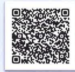
会社のPR動画はこちらよりご覧いただけます

○福利厚生：産休・育休制度あり、平均有給休暇取得日数6.5日(前年度実績) ○自己啓発支援：資格試験(衛生管理者、フォークリフト運転免許等)や検定試験(ビジネスキャリア検定試験等)の受験料助成、資格手当支給を行っています。その他にも希望する研修を積極的に受講していただける環境となっております。