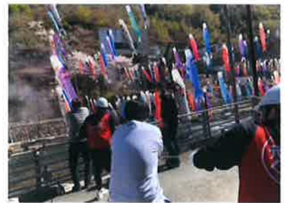
ボランティア活動の様子

接客の仕事がしたい、クルマが好き等この会社を選んだキッカケはそれぞれですが、事業を通して地域社会への貢献であったり、地球環境保全に対する取り組みもあって魅力を感じました。年齢の近い若いスタッフが多くいますのでスタッフ同士が仲良く、先輩も親身になって相談ののってくれます。資格取得支援がありますのでスキルアップが可能です。自分の家族も社員割引でレンタカーを利用できるのも魅力です。