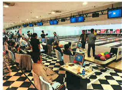
レクリエーション（ボウリング大会）

交通信号機など、人々のライフラインに欠かせない公共物の工事を行えることにやりがいを感じます。また、個人のスキルアップのための資格取得に向けたサポートが充実しています。