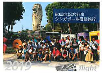
研修旅行の様子@シンガポール

歴史が長く、地に足の着いた堅実な会社であることから入社を希望しました。入社後は先輩社員に教えていただきながら、技術力が求められる大手住宅メーカーや公共工事を相手にしていくため“真の技術”が身につく職場であることを実感しています。仕事にしっかりと向き合った後は、オフの時間も充実しており、“なりたい自分”になれるそんな職場です。