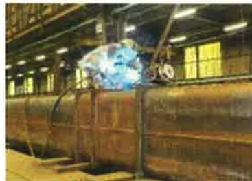
柱を溶接しています

昭和22年創業以来、「誠実と信頼」をモットーとして企業活動に取り組んで参りました。私達は「真のものづくり企業」を目指す鉄骨ファブリーケーターです。九州をはじめ全国の公共施設の庁舎や高層ビルなどの大型建築構造物の骨組みとなる鉄骨の、設計から施工・現場建方までを幅広く行う会社です。3年前にTAKUMINOグループの傘下に入り、福利厚生も手厚くなりました。