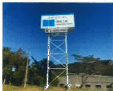
会社入り口看板 国道3号線から見えます

博陽工業を選んだきっかけは、学校の先生からの紹介もあり、家から近くて通勤しやすく地元の中では大きな会社だったからです。入社後の印象は、先輩や上司はとても優しく職場の雰囲気も良く、すぐに馴染めると感じます。また、確定拠出年金制度や退職一時金制度が手厚く、将来の不安がないのも魅力だと思います。