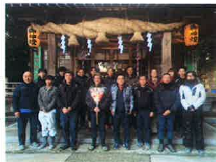
令和6年1月仕事始めの安全祈願

数社の職場見学に行きましたが、ヒロの現場で建設機械を動かしている様子やコンクリートを均しているところを見て興味がわきました。入社1ヶ月後には2泊3日の社会人基礎研修で社会人としての心構えを学びました。何もわからないところからのスタートでしたが、先輩方が現場で丁寧に教えて下さいます。様々な工具の名前を覚えたり、使い方も最初はとても難しく感じましたが、少しずつ上手に扱えるようになってきました。これから玉掛等いろいろな講習に行ったり、来年には2級建設機械施工管理技士の1次検定も受検する予定です。資格取得もしっかりサポートしてくれるし、同年代の社員もいて、話しやすく相談しやすい環境も入社して良かったですと思いました。