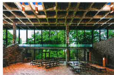
建築工事の施工事例

国や、県、地元の水俣市を中心に土木・建築工事を施工している会社ですが、地元中小企業の殆どは、地元近辺だけのお仕事为中心である一方、我々は地元だけに留まらず、東北地方や、熊本県内各市町村の災害復旧現場へも積極的に協力し、より沢山の場所や人達に建設業者である我々の技術で貢献していく事で、より多くの経験を積み、常に成長していく事を目指しています。