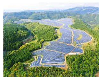
土木工事の施工事例

建設業はキツイ、汚い、危険というイメージが正直先行していましたが、入ってみると、どうしたら楽に、そしてキレイで安全に施工出来るのか？という事について日々試行錯誤、実行している事を知りました。普段の生活に直接的に関わるインフラ整備に携われ、自分の仕事も目に見えて残るといふ建設業独自の魅力が分かってきた事で、最初のイメージとは全く異なり、とてもやりがいを感じています。（H29年入社）