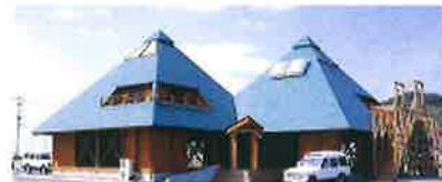
ログハウス展示場

熊本県産材の杉や桧をはじめ、国産の優良材を製材しています。厳選した原木の製材、加工、機械乾燥処理を丁寧に行っており、製材・乾燥・造作のJAS認定、合法木材事業者認定等を受けております。個人創業から90年になる長い歴史と信用で、県内をはじめ全国に販路があります。