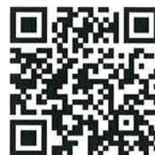
本社ホームページ

全く別の業種からの転職で、初めは建設業の用語も分からずで大変でしたが、先輩方に様々な事柄を教えていただき、今では工事を任せてもらえる立場となり、大きな責任と共に、仲間と協議し協力し成し遂げた工事は、達成感があり、市の表彰を受ける事になり、自分自身とても成長していると感じれる日々を送って取り組んでいます。