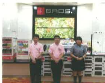
店内の様子（宇城小川店）

（選んだきっかけ） パチンコ・スロットに興味があり、地元で就職したかったため （入社後の印象） 新入社員（経験者、未経験者問わず）にはマニュアルに沿って丁寧に教えてくれ勤続年数の長い人も多く働きやすい環境です。時間にメリハリがあり残業も基本ありません