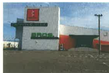
店舗外観（八代鏡店）

熊本県内に5店舗福岡県に1店舗のパチンコホール運営を行っている会社です。 ☆年2回、各店舗での懇親会 社員同士でコミュニケーションUP!! ☆毎年誕生月の給与日にお誕生祝金の支給