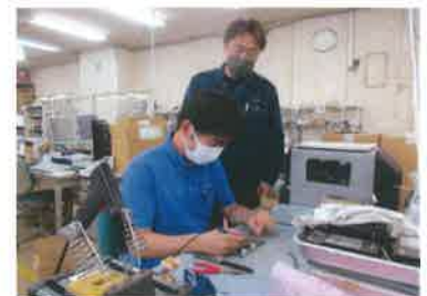
職場における指導の様子

若い先輩や上司が多く、丁寧に理解できるまで指導してくれます。会社は、資格取得やスキルアップにも熱心で資格取得のために必要な講習の受講料や受験料など全額もしくは一部補助もあります。健康経営優良法人やプライト企業に認定されるなど従業員を大事にしています。