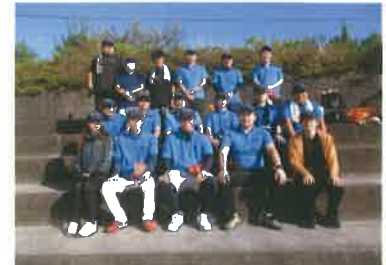
職場親善ソフトボールに参加

創業以来、電気通信機器（公衆電話、ビジネスホン、FAX、ホームテレホンなど）の修理や製造、インターネットに必要なONUの再生などを主な生業としてきました。現在ではそのスキルやノウハウを活かして電気通信工事などに使用する治具など新商品の開発や様々なものづくりを行っています。