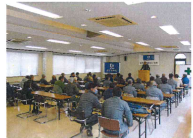
年末の社長あいさつ

友人の紹介で現場の監督として入社することになりました。入社後の印象は、現場もちろんですが細やかな原価管理や工事以外の活動が他とは全く違ったことです。新しい取り組みには瞬時に対応し、資格・免許所得のための制度も充実しているので環境もとてもいいと思います。