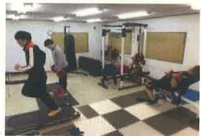
トレーニングルーム

同じものを大量に製造するのではなく、少量で多くの種類のものを製造しています。そのため、いろんな製造方法を学べたりいろんな形に触れることができる楽しみがあります。また、若い方も女性も多いため、活気のある明るい職場です。未経験者でまったくの知識がなくても丁寧に教えてくれ、質問しやすい先輩ばかりです。また、社内の勉強会や外部の勉強会にも行けるので、教育サポートも安心です。