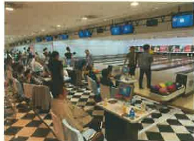
レクリエーション（ボウリング大会）

交通信号機など、人々のライフラインに欠かせない公共物の工事を行えることにやりがいを感じます。また、個人のスキルアップのための資格取得に向けたサポートが充実しています。