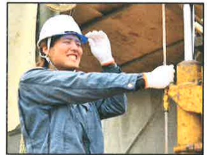
<井戸掘削機操作中！>