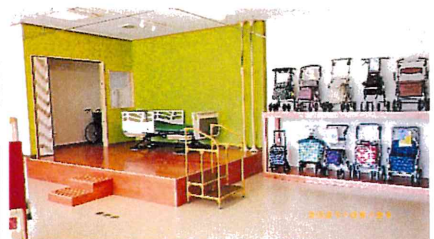
展示室 体験コーナー

「福祉用具を専門的に勉強したい」「企業説明会で興味を持った」「身体の不自由な祖母との同居で福祉用具をもっと知りたい」がきっかけです。最初は不安もありましたが、丁寧にわかりやすく指導していただき、一つずつ理解しながら仕事に取り組んでいます。一日でも早くひとり立ちできるよう頑張ります。（令和4年4月1日入社の高卒社員3名から）