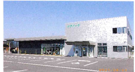
八代本社 社屋外観

1999年7月に会社設立し、八代本社・水俣営業所・熊本南店（宇土市）の3営業所で、日常生活に支障がある方々も住み慣れたご自宅で、より安全に安心して生活して頂けるように介護保険制度の福祉用具貸与・特定福祉用具販売事業をはじめ、段差解消などの住宅のリフォーム工事や各種介護機器・用品などの一般販売を行い、地域の介護をサポートしています。