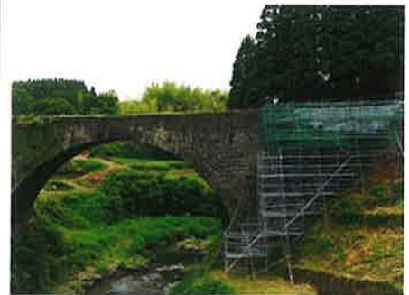
通潤橋 大雨災害復旧工事 施工状況

「女性での現場監督は苦労がありそう」と思われるかもしれませんが、実際は男女差を感じることはなく働いています。本人がステップアップしたい場合は、会社全体でサポートできる社風があります。現在はGPSを使った重機の発達など日々進化しており、現場の負担は軽減してきています。女性や経験のない方でも気軽に挑戦すると、やりがいを感じられる仕事だと思います。