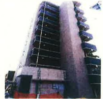
マンション新築工事外壁施工写真

業界希少のタイル専門施工工事会社です。先代から続く施工技術の高い職人が10名（タイル張り1級技能士）在籍、高い技術を丁寧に指導出来ます。大手建設会社など取引先も充実しています。社会保険に加入しています。