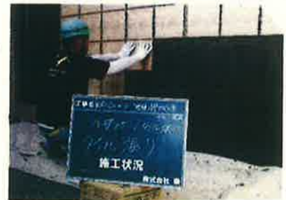
タイル張り工事風景

会社を選んだ理由は物作りに興味があり職人人口も少ない為今後の活躍の場が沢山あるという事で入社を決めました。入社後の印象は大変な事もありますが、他の職人さん達が優しく教えて下さるので毎日充実しています。