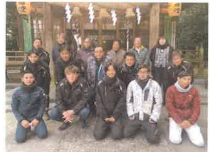
令和5年1月仕事始めの安全祈願

体を動かすのが好きだったので選びました。入社1ヶ月後には2泊3日の社会人基礎研修で社会人としての心構えを学びました。何もわからないところからのスタートでしたが、先輩方が現場で丁寧に教えて下さいます。様々な工具の使い方も、最初はとても難しく失敗も多かったものの段々と上手に扱えるようになりました。この1年で準中型自動車免許や玉掛けの資格も取得、今年は2級建設機械施工管理技士の1次検定も受検します。資格取得もしっかりサポートしてくれるし、同年代の社員もいて、話しやすく相談しやすい環境も入社して良かったです。