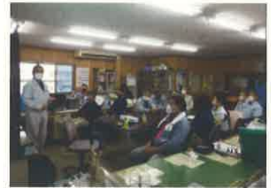
社内の様子（講話中）

建設業についてはほとんど知識もなく入社しましたが、先輩社員の方々に一から丁寧に教えていただき、少しずつ覚えていっている途中です。公共工事の施行管理という重要な仕事を学び、今後携わっていくのだと思うと誇らしさややりがいがあると思います。また、資格も取得することができるので、ますますスキルアップを図ることができます。