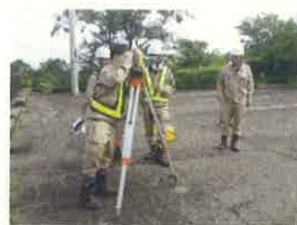
新入社員研修風景_R5年度

当社は、地域の皆様が快適な暮らしを続けるために必要となる道路や河川、港、公園などの社会資本を形作る「測量・設計」を行う会社です。近年はDX化に伴い新技術を用いた測量（ドローン・レーザー測量など）や3次元設計など、若手技術者を中心として積極的に取組んでいます。