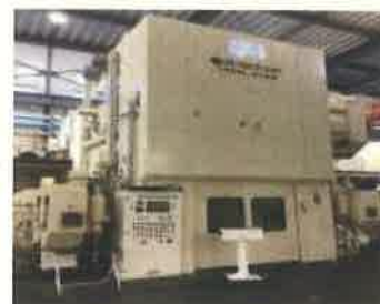
最新の鍛造プレス機

入社する際は、鍛造業とはどういった業種だろうと思っていました。いざ、工場見学をしてみるとものすごい音（プレス音）とプレスの動きで製品が出来ていくのを見て、ものすごい技術だと実感しました。入社後もモノづくりに携わり自分で造ったものが自動車に搭載され世の中の役に立っていると思うと非常にやりがいのある業種だと感じました。