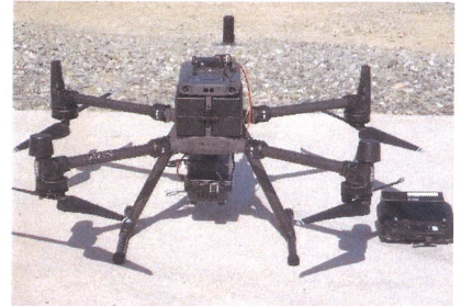
UAV3次元レーザー（ドローン）

＼新事業への進出！！／ 県内でも数少ない最先端【UAV3次元レーザー測量システム】導入 最新の技術サービスの提供によって、高い顧客満足度に応え、さらなる信頼実績と社会貢献に尽力します。