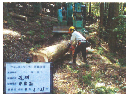
チェーンソー造材（入社1年目）

・入社後の印象は、仕事熱心な方が多く後輩の指導にもかなり力 を入れられていると思った。・地元で仕事をしたいと考えてい た為、知り合いの方や家族と相談して決めた。・入社してすぐ に資格取得の為に研修を行ってもらえるので仕事に対するやりが いや達成感が得られる職場だと思う。作業内容等ははてとりあしと りおしえてくださるので、自分自身の技術の向上やスキルアップ をすることが出来る。（入社4年目）