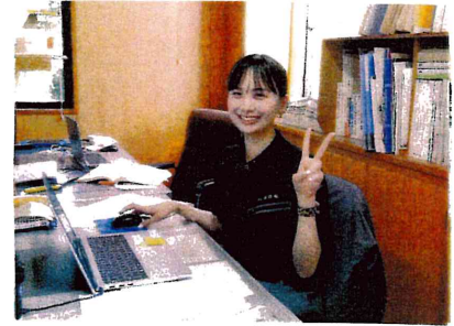
令和5年4月1日入社の新入 870

八代市で創業して60年、地域と共に成長している建設会社で、お客様のオンリーワンの注文住宅を施工しアフターフォローにも努めております。口コミで来社されるお客様もいらっしゃいます。