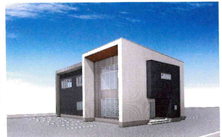
↑ 2023年8月完成の新社屋

金剛設備工業は創業50周年の地元根拠地企業です。アットホームで離職率も低く、和気あいあいとしています。設備業界のリーディングカンパニーを目指し、さまざまなことに取り組み、進化し続けています。