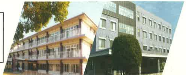
《 会社の外観 とイベント風景 》

地域に根差し住み慣れた地域で人々とともに、明るく楽しく生き活きたした生活の場を築き、地域拠点として常に一歩先を見つめ新しい文化を創造し、育んでいきます。