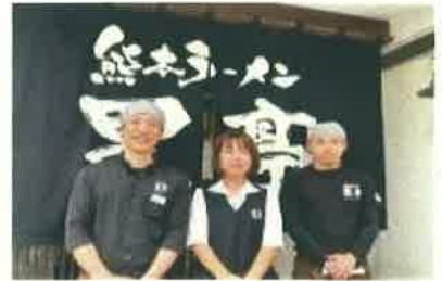
スタッフ・社長（中央）

創業66年の熊本ラーメン黒亭を4店舗経営（熊本市内に3店舗、菊陽町に1店舗）。1日平均200～300名のお客様が来店されます。お土産ラーメン事業では県外でも取り扱いがあり、商圈を拡大中です。通販事業にも力を入れており、大手ショッピングサイトに出店。海外展開も視野に入れています。熊本を代表するラーメン店として、熊本の食文化に貢献し続けます。