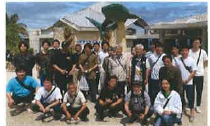
《グループ会社合同社員旅行》

業務遂行能力向上および自己啓発を促進し、業務効率の向上を図ることを目的として社内対象の資格取得支援制度を定めています。取得後社内対象の資格の取得者へは資格手当を支給しています。又、技術力向上の為、グループ会社合同で技術発表会、福利厚生として隔年ですが社内懇親会費を積立しグループ会社合同で社員旅行を開催しています。社内規定該当者においては、住宅手当を支給致します。