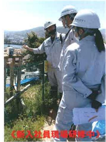
《新入社員現場研修中》

防災技術を駆使し、地域の未来を守る。 アイエステーは、たゆまない技術向上により、地域防災事業に携わるとともに地域の安全・安心を確保できるインフラ整備に貢献します。レーザースキャナ搭載のUAV（ドローン）など様々な新技術を使用し、防災、インフラの調査・解析・設計を行い、住民の安全・安心を確保する仕事をしています。