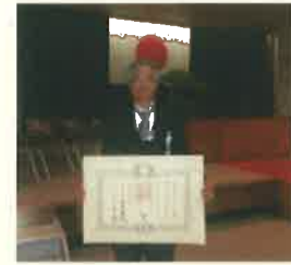
仕上工事部次長は、永年の技能技術貢献の功績で令和5年春の叙勲「瑞宝単光章」を受章しました！

こざきが地震の修復工事に携わっていることを知り、興味を持ったことがきっかけです。改修工事は新築工事よりコストが節約できるため、環境と経済の両面から今後も需要があると考えたからです。携わった工事が無事に竣工を迎え、マンションの入居者様から感謝のお言葉を頂くことができると頑張っていると良かったとやりがいを感じます！