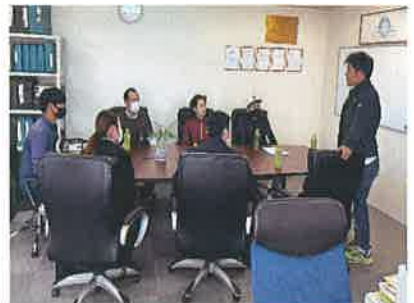
新入社員研修の様子

研修制度が充実しているところに魅力を感じ入社しました。 上棟（棟上げ）は一日で住宅の屋根までの骨組みが出来上がります。 毎日達成感を味わうことのできるとてもやりがいのある仕事です。 20代～30代が中心の若手集団で、和気あいあいとしている職場です。 完全成果主義！自分の頑張り次第でどこまでも登っていきける、そんな会社です。