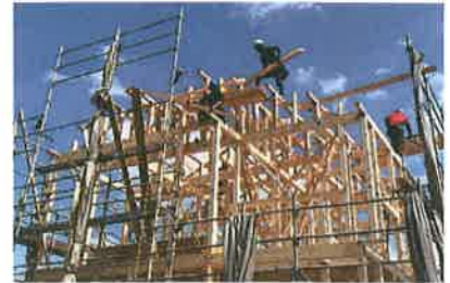
棟上げ工事の様子

熊本に本社、福岡に1事業所あります。 住宅メーカー様から依頼を受け、新築住宅の上棟（棟上げ）工事を専門に行っており、年間800棟以上の実績があります。 大工の高齢化が深刻化している昨今、若手の大工がおおいに活躍できる会社です。 「学び、挑戦し、成長し続ける」仕事を通じた人間成長を目指しています。