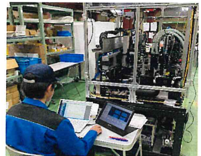
製品出荷前調整の様子

高校の先生からの紹介で職場見学をした際、機械を製造している仕事の内容に感心し、やりがいを感じたことがきっかけです。現在メカ設計の部署に配属されましたが、不明な点をわかりやすく丁寧に指導いただいています。いろいろな機械要素についての知識を得ることができ、楽しく仕事をしています。