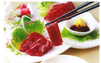
「鮮馬刺し」を作っています

地元の食品メーカーで働きたいとこの会社を希望しました。また、熊本の特産品の馬刺しを製造するというのも理由の一つです。製造に携わった商品が全国のお客様の所へ届き、喜んで頂けているので、とてもやりがいを感じています。