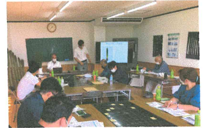
主催する産地研修の様子

初めての業界で働いた当初は続けられるか不安でしたが、9月で12年目になります。社内の雰囲気も良く、分からない事も聞きやすい環境で、入社当時と比べると出来る範囲が広がりました。営業に出れば全国のお客さんと話もできるので楽しいです。（38歳）