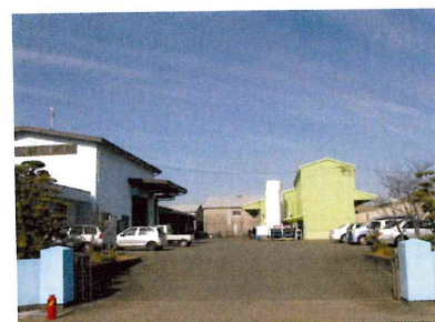
新港ガスセンター

普段の生活ではあまり見かけない商品を取り扱っているのですが、最初は商品などを覚えるのに時間がかかりますが社内での勉強会などがあり自然と覚えます。また、ほとんどの仕事で国家資格が必要なので会社から受験させてもらえて個人のレベルアップにつながります。