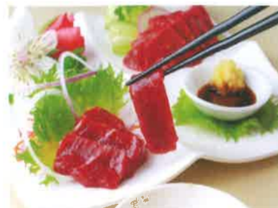
「鮮馬刺し」を作っています

地元の食品メーカーで働きたくてこの会社を希望しました。熊本の郷土食である馬刺しを扱うレストランで、未経験で勤務することは不安でしたが、簡単な作業から入り、包丁の使い方も先輩がしっかりと教えてくれました。お客様から「美味しかった」「また菅乃屋の馬刺しを食べたくて来ました」というお言葉をいただき、この仕事に就いてよかったと思います。