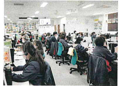
社内の写真（コールセンター）

私たち大崙屋は、熊本をはじめ全国約400軒のこだわりの契約農家・牧場主より、旬のフルーツや熊本特産馬刺などを通信販売でお届けしております。お届けする商品の中に、農家さんの顔写真やお名前・産地・こだわり等が載ったリーフレットを入れています。農家さんの想いとともにお届けし、契約農家さんとお客様をつなぐ役割を果たしております。自分の家族にも安心してすすめられるような、本当に美味しい商品で幸せの輪を広げています。