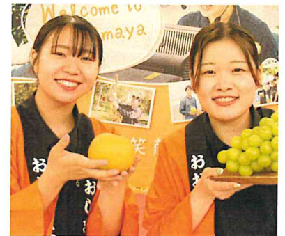
メンター同士の写真

大崙屋に魅力を感じた点は2つあって、活気のある風通しの良い社風と熊本の良さを全国に広められるところでした。1人1人に向き合ってくれて、こんなに真剣に話を聞いてくれる会社めったにないと思います。入社してからギャップは全然なく、会社説明会などで感じた通り従業員みんなが助け合っています。熊本の美味しい食品、全国の果物を通じて多くの方に笑顔を届けることができる会社です！