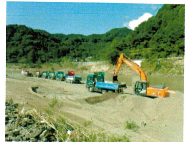
R2球磨川生名子地区災害復旧工事

職場体験会での会社の印象が良かった事と、自分と同じ高校出身の先輩方が7名在籍されているという事がきっかけでした。入社直後、実際の現場では初めて体験する事の連続で失敗も多く、この先うまくやっていけるかとても不安でした。それでも先輩方のアドバイスを受けながら仕事を覚え、職場の雰囲気にも慣れていくうちに少しずつ自信を持てるようになりました。今後の目標は、技術をより多く習得するのはもちろん、先輩方のように現場の業務に必要な免許や資格の取得に挑戦し、一人前の技術者として現場を任せてもらえるようになる事です。