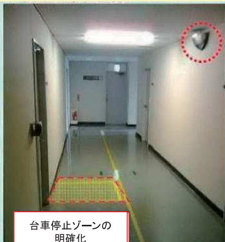
台車停止ゾーンの 明確化