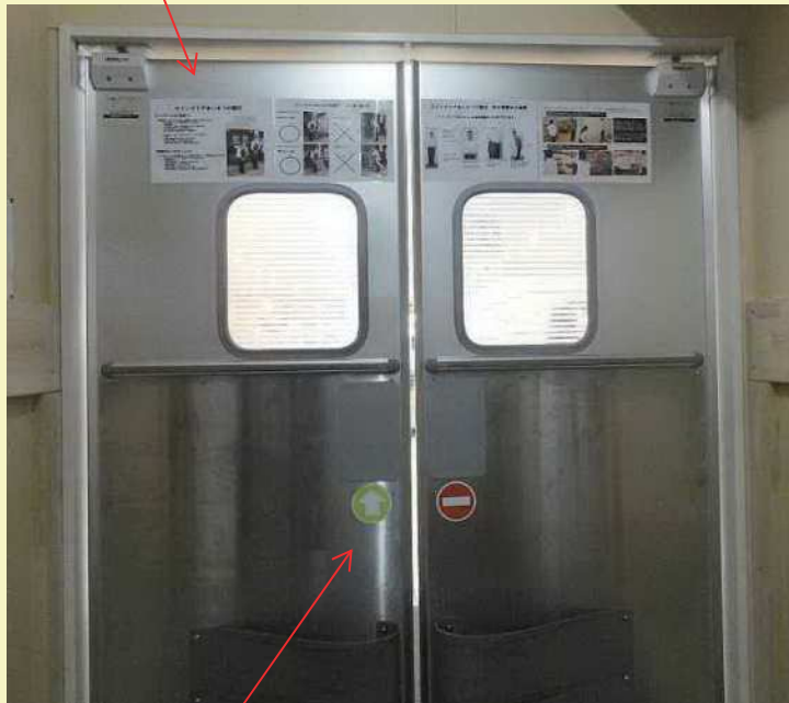
店内へのスイングドアに出入りの方向を表示。