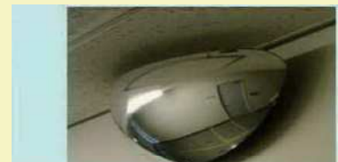
通路に出る時の衝突防止の確認ミラーを設置