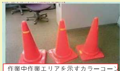
作業中作業エリアを示すカラーコーン