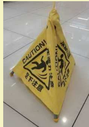
水濡れ注意表示（表示をしてモップ等を取りに行く。）